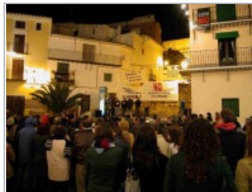
Decenas de vecinos se concentraron en Les Coves el sábado, en el último acto de protesta contra los vertederos tóxicos antes de la moción de censura.

Esta actividad reivindicativa también ha coqueteado con la política en algunos