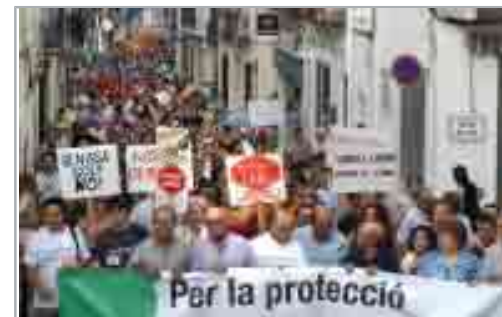
Manifestación vecinal en Benissa contra la tentativa de una urbanizadora de desarrollar un macro complejo turístico en suelo agrícola.

La magnitud del vertedero, similar a 14 campos de fútbol, horrorizaba a los habitantes de