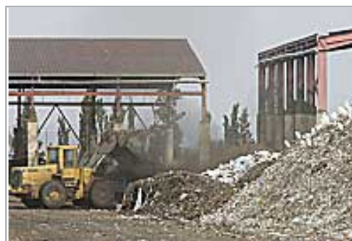
Una excavadora amontona los residuos del vertedero de Guadassuar.

Para eliminar estos residuos, las administraciones han diseñado un proyecto que incluye 24 plantas de tratamiento, cinco vertederos –que los vecinos de los municipios afectados rechazan– y 400 ecoparques. Está previsto que los valencianos puedan tratar sus desechos en las nuevas instalaciones a mediados de 2007.