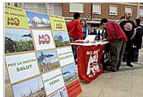
Uno de los paneles y de las mesas de recogida de firmas instaladas ayer en la plaza de Las Aulas.