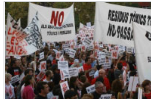
Cientos de manifestantes muestran su rechazo, ayer en Castellón, a las plantas de residuos tóxicos proyectadas en Les Coves, Fanzara y la Salzadella.

Eran las 20.30 horas, 90 minutos después de que unas 4.000 personas llegadas del interior de la provincia se congregaran en la plaza de la